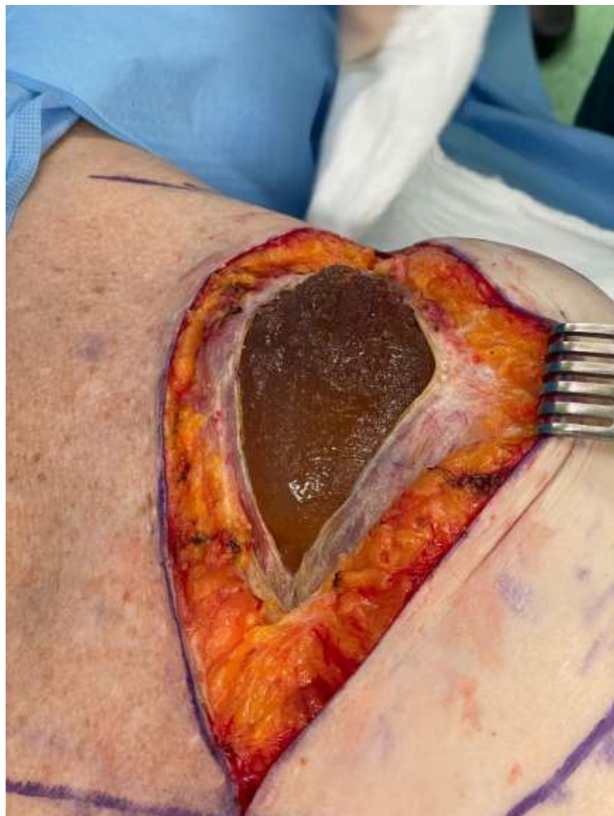
Slika 3. Intraoperativno prikazana ruptura silikonskog implantata