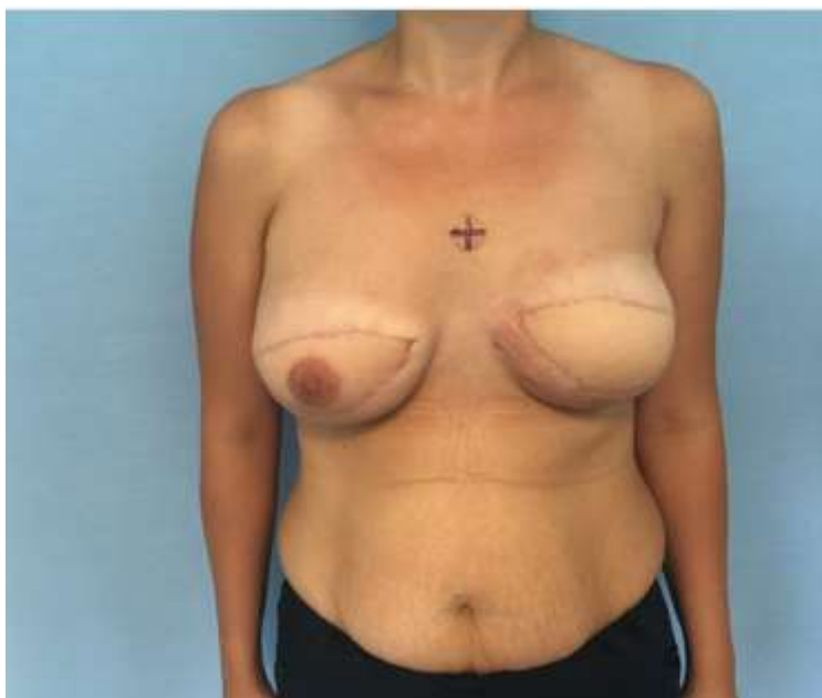
Slika 6. Pacijentica nakon bilateralne mastektomije i obostrane hibridne rekonstrukcije dojke reznjem širokog leđnog mišića i implantatima