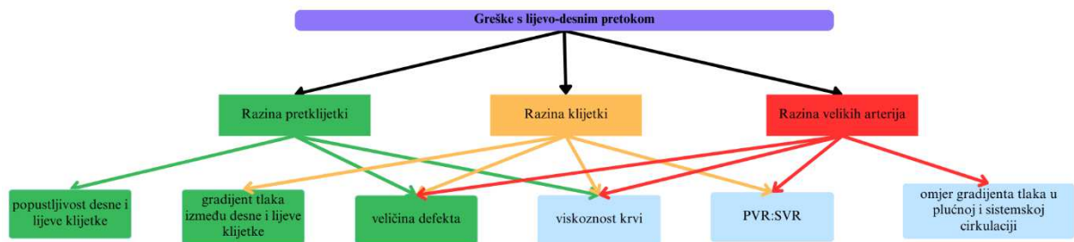
Slika 2. Patofiziologija lezija s lijevo-desnim pretokom. Utjecaj hemodinamskih čimbenika na veličinu protoka kroz šant; preuzeto i prilagođeno prema (64).