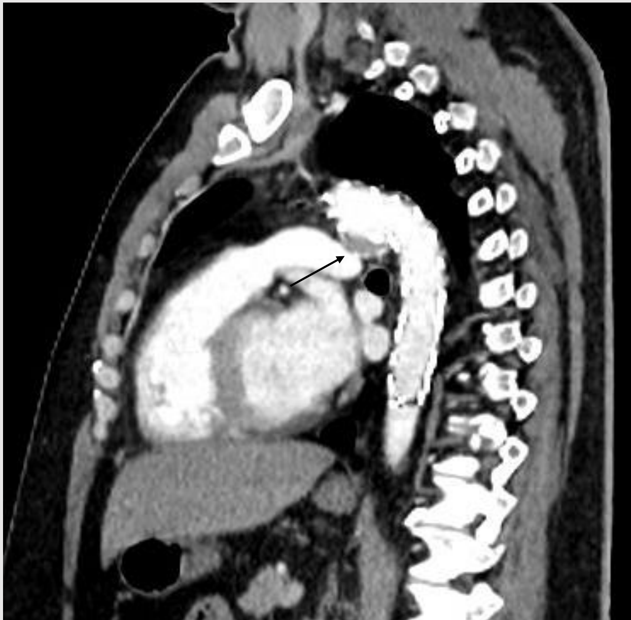
Slika 2. MSCT aortografija nakon TEVAR-a zbog sakularne aneurizme početnog dijela descendente torakalne aorte (uredan nalaz - obliterated aneurizma označena je strelicom).